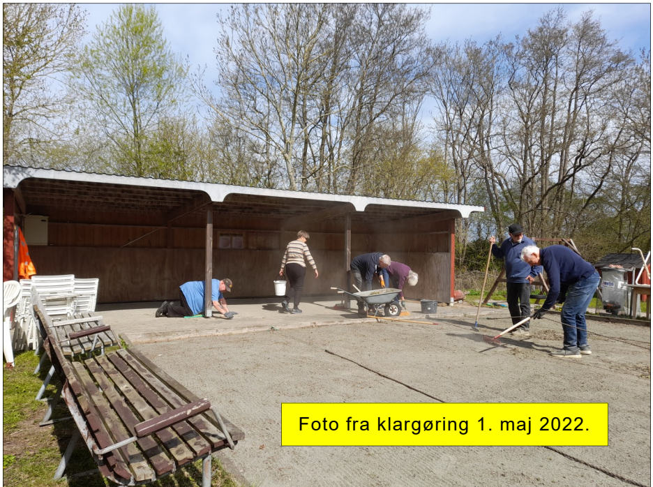
Foto fra klargøring 1. maj 2022.

Når arbejdet er færdigt 1. maj, slutter vi af med grillpølser og en øl/vand.