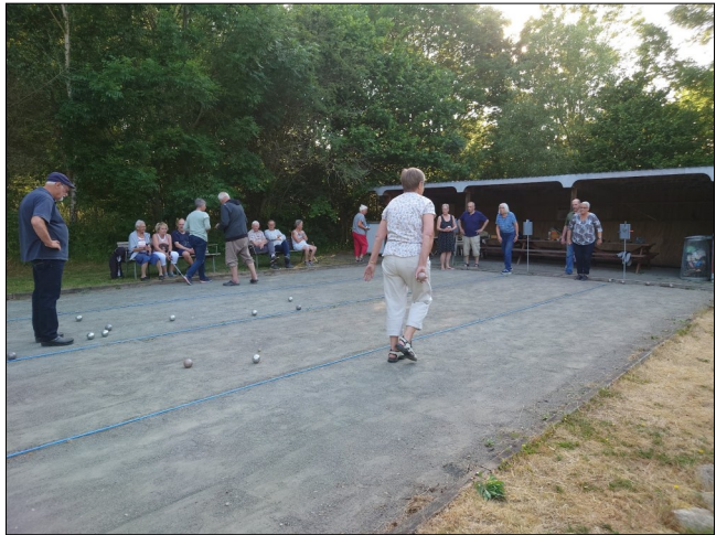
Foto fra en spilleaften i 2023