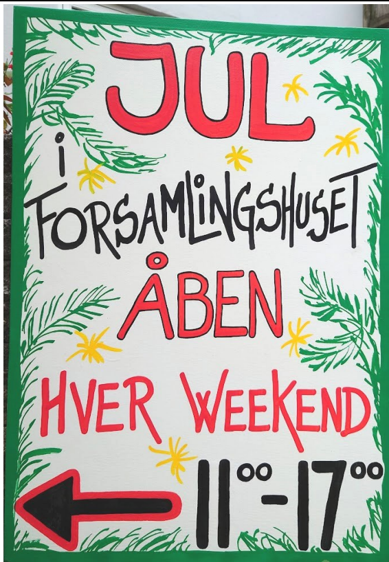
Skiltet for enden af Kjærvej

Nu håber vi på samme store opbakning til julestuen, som sidste år og ser frem til, at vi igen skal holde julestue i forsamlingshuset.